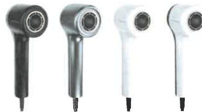
* reference picture / different colors available

Lavagrau / Perlmutterweiß / Schwarz/Stahlsilber / Schwarz/Perlmutterweiß